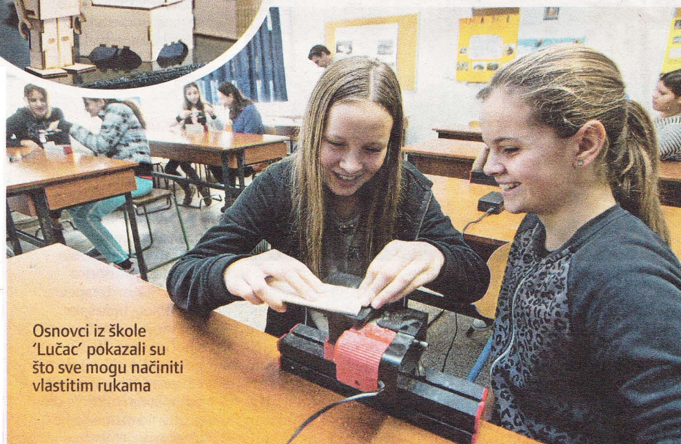
Osnovci iz škole 'Lučac' pokazali su što sve mogu načiniti vlastitim rukama