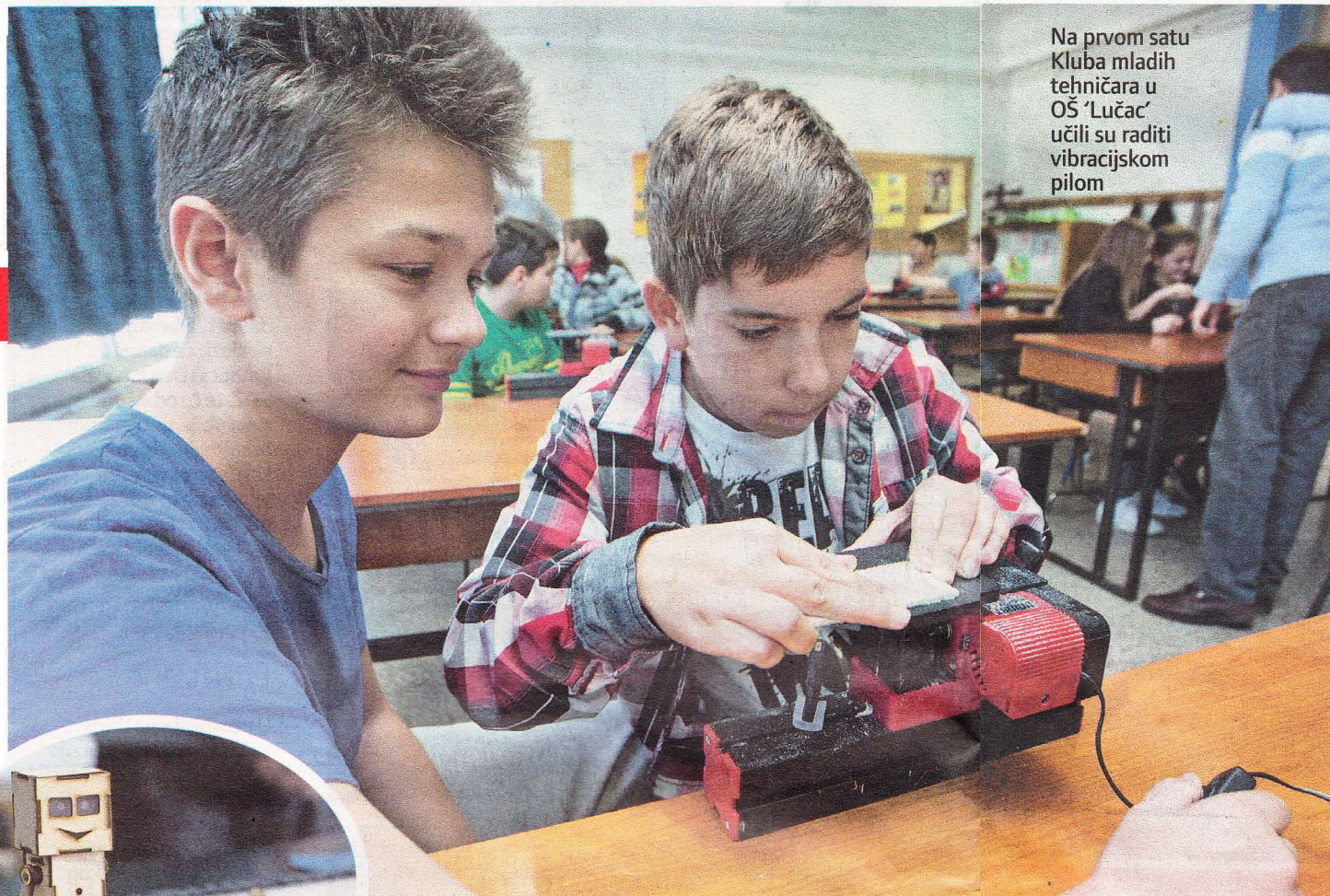
Na prvom satu Kluba mladih tehničara u OŠ 'Lučac' učili su raditi vibracijskom pilom

Naime, grad je u namjeri da uštedi - počeo štedjeti na onima na kojima nije trebao, no to je neka druga priča.